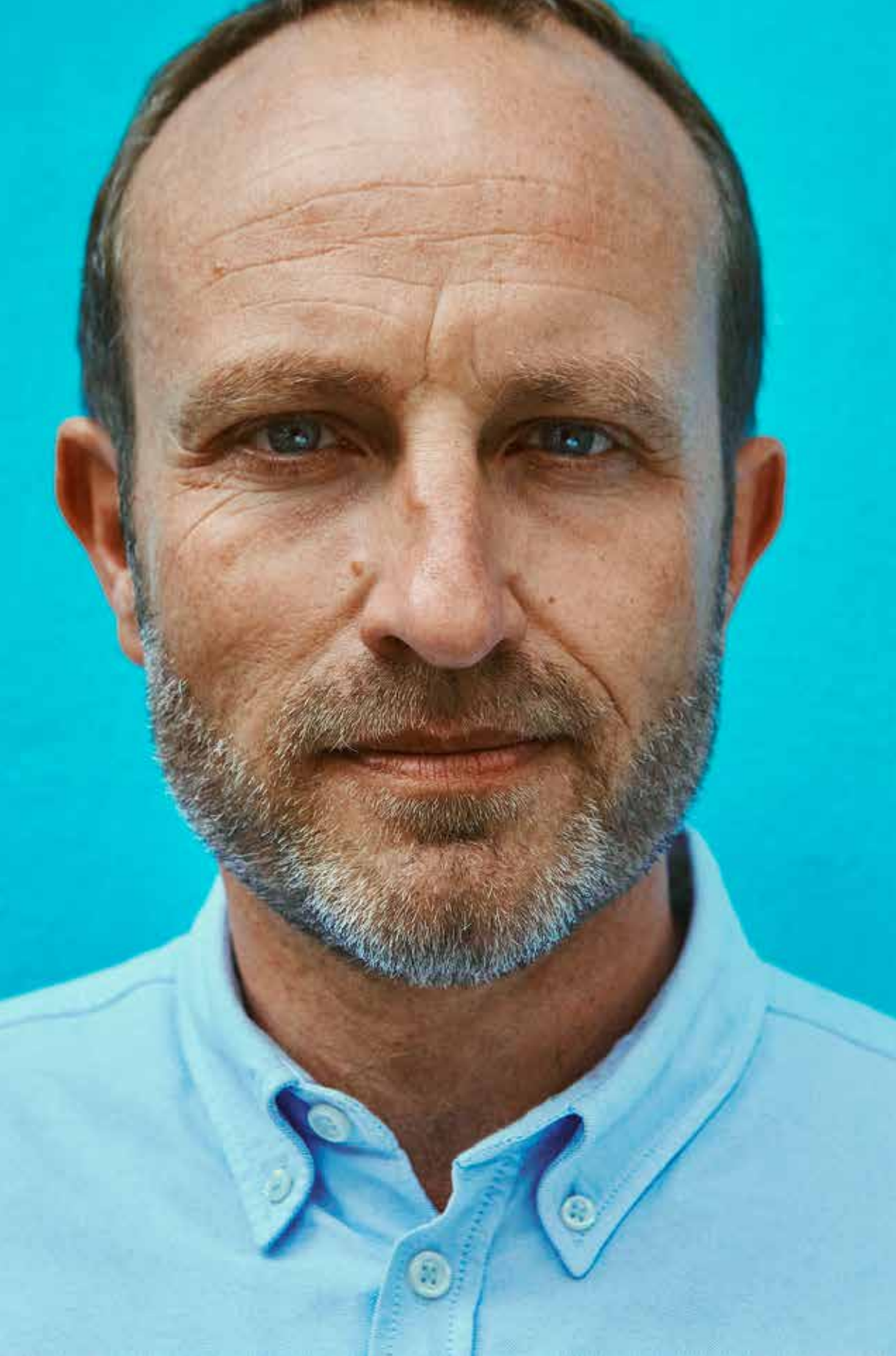
Martin Lidegaard mistede posten som udenrigsminister, men blev til gengæld atter valgt ind i Folketinget. Spørger man ham til verdens tilstand, svarer han: "Jeg selv har det godt, men verden har det skidt, tak."